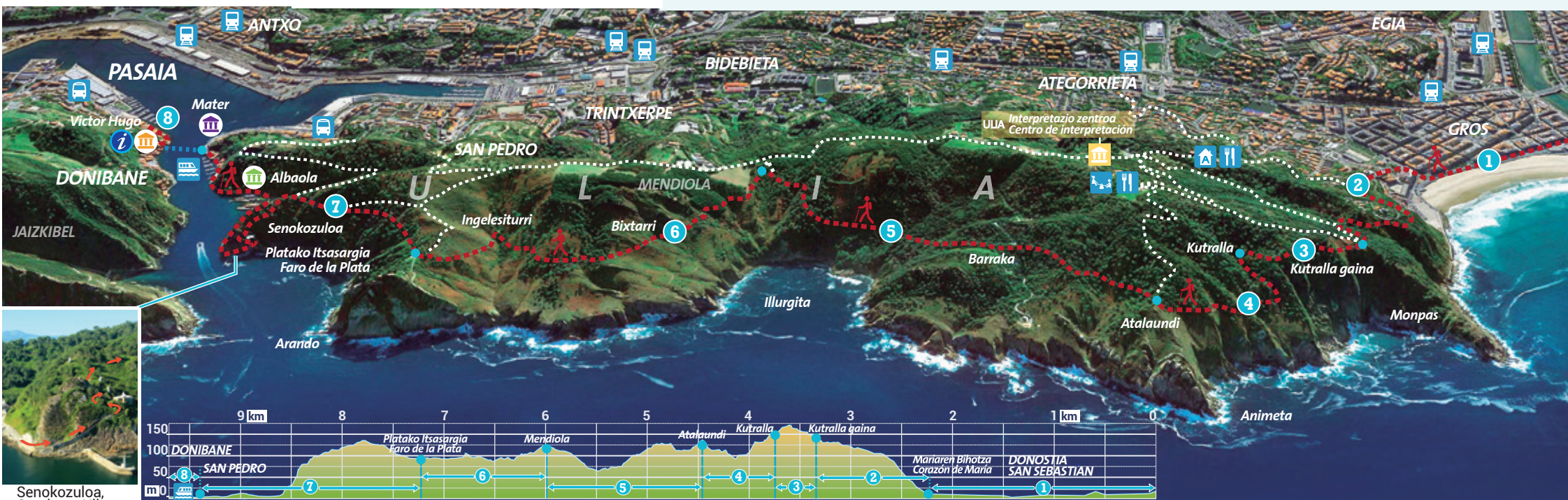
Senokozuloa, Camino a Ulia

Desde el final del Paseo Nuevo en uno de los extremos de la bahía de La Concha, muy cerca de donde las olas rompen con más fuerza, comienza el puerto donostiarra, y desde ese punto enlazamos a través de los hitos culturales y naturales más importantes de esta costa con el interior de la bahía de Pasaia. El recorrido, que forma parte del sendero Talaia o GR-121, se puede hacer en ambos sentidos, si bien aquí se explica en dirección Oeste-Este, de San Sebastián a Pasaia, y es descrito por secciones o tramos. La duración del paseo es de unas 4 a 5 horas aproximadamente. El regreso, o la ida indistintamente, se puede hacer cómoda y rápidamente en transporte público. Hay en Ulia y toda la zona otras muchas rutas y senderos, sin embargo a causa de su dificultad, por la falta de señalización o por el posible riesgo que puedan presentar para caminantes inexpertos no se describen en esta publicación. La ruta propuesta discurre por una costa abrupta de acantilados, con riesgos mínimos pero aun así existentes, por lo que es necesario extremar la prudencia.