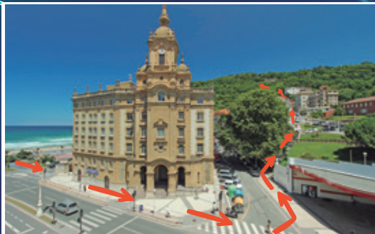
Iglesia del Corazón de María, subida a Ulia

Ulia, un lugar misterioso, bello, salvaje y deshabitado. Para muchos sus curiosas rocas y espectaculares acantilados custodiados por cientos de gaviotas, sus relieves cambiantes, su olor a helechos, sus praderas y brezales junto al mar y su plena armonía son naturaleza evocadora y en estado puro. En Ulia la ciudad desaparece, el mar abraza un monte abrupto y rocoso, y así, lejos del mundanal ruido, no estamos ya ni en San Sebastián ni en Pasaia, sino en nuestra pequeña arcadia en verdadero contacto con el espíritu de la naturaleza.